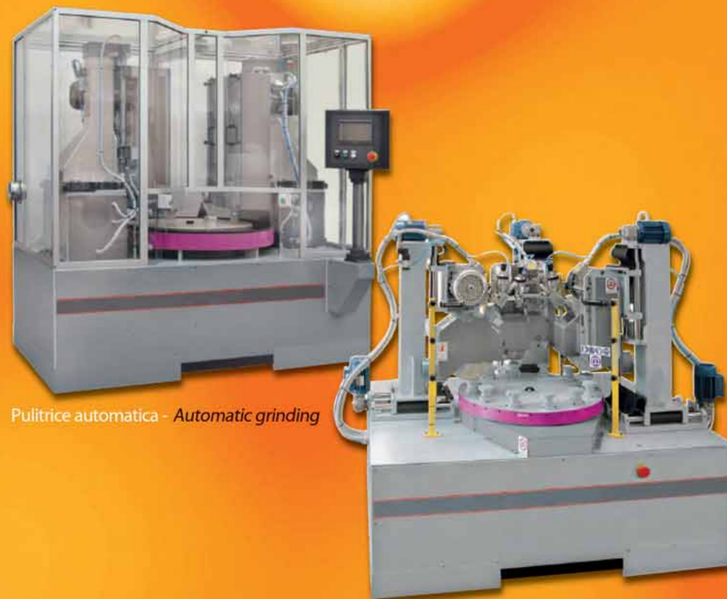
Pulitrice automatica - Automatic grinding