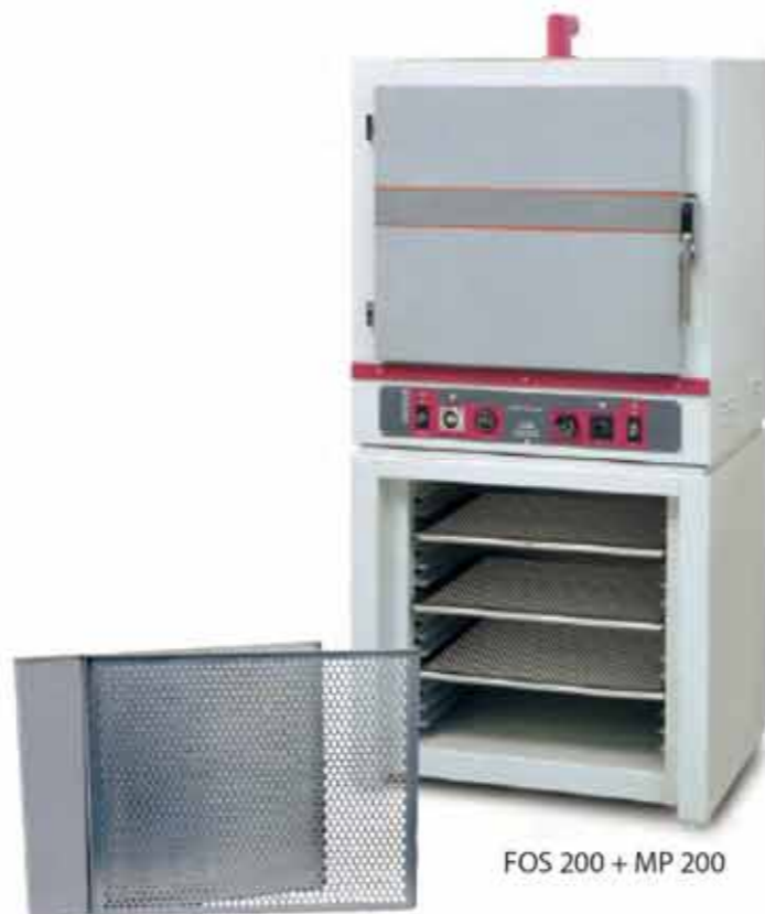
FOS 200 + MP 200

The enamel dispenser DIS can be fitted with a wide range of syringes (10-30-60 cc) connectors, joints and needles (from 0,5 to 1,6 mm diameter) for the various applications. The piece of equipment is completed with 3 enamelling paddles: inclined, straight and L shaped.