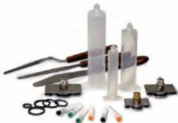
Kit siringhe - Kit of syringes